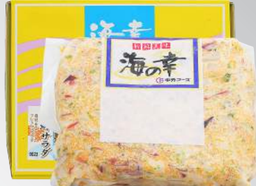
調味海鮮沙拉 規格：1公斤