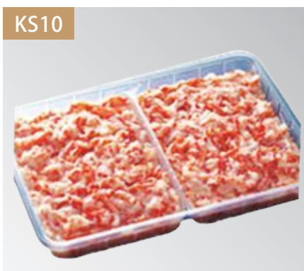
紅ズワイ棒くずれ