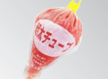
雙葉明太子沙拉 規格：500克