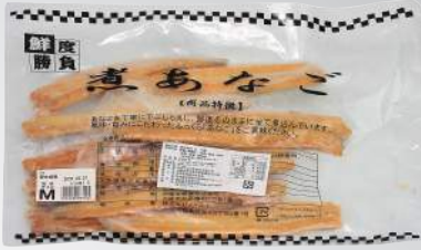
穴子 (星鰻) 規格：每盒4/6/8/10尾