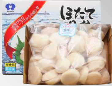
日本生食干貝 規格：1KG (Size: 2L/L/M/2S/3S/4S)