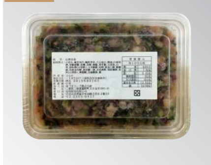
山葵章魚 規格：1公斤