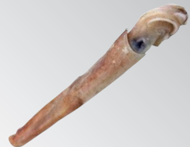
透抽 規格：20~25 25~30 30~35 35~40CM