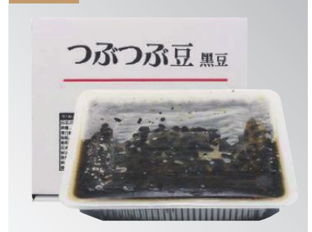
台製黑豆 規格：1公斤