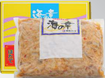
調味干貝唇 規格：1公斤