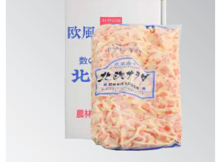
伊予屋北歐沙拉(紅) 規格：1公斤