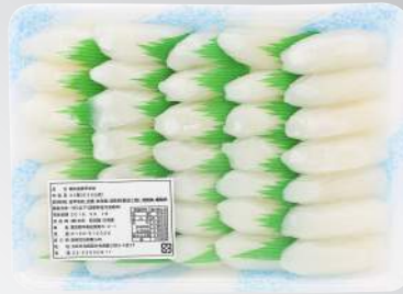
板前紋甲花枝 規格：1盒(35片)