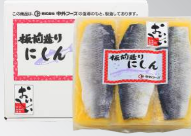
調味黃金鯧魚 規格：900克