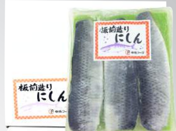
調味芥末鯧魚 規格：1公斤