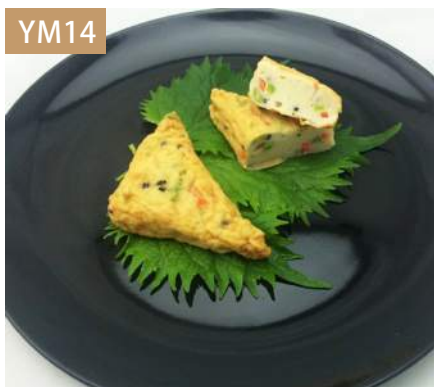
三角野菜豆腐 規格：3kg x 4袋入