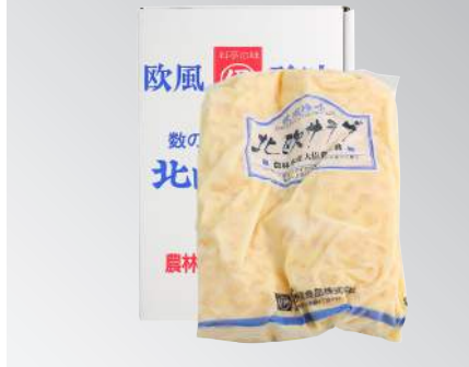
伊予屋北歐沙拉 規格：1公斤