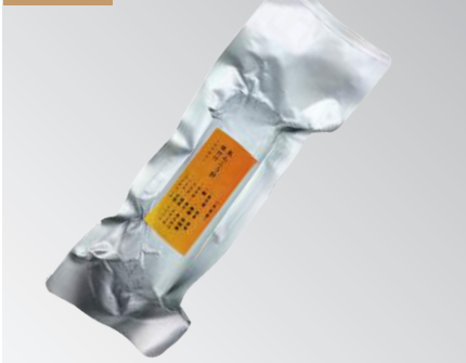
調味鮫鱻魚肝 規格：500克