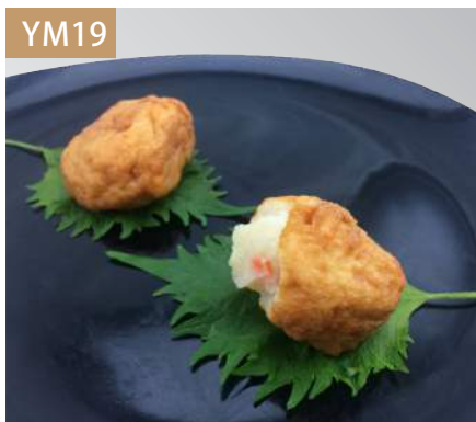
沙拉丸子 規格：3kg x 4袋入