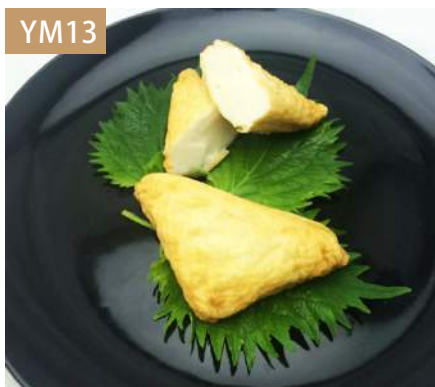
三角原味豆腐 規格：3kg x 4袋入