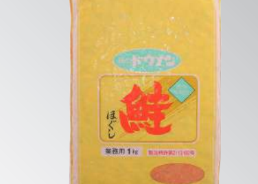
道南鮭魚鬆 規格：1公斤