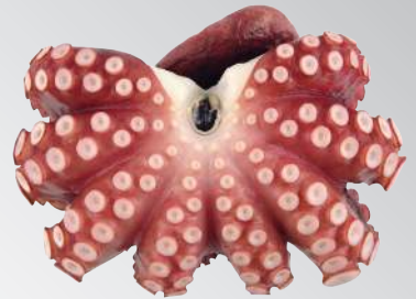
熟大章魚 規格：約1公斤