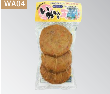
若女花枝天 規格：20包 x 2盒