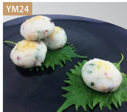
蔥燒章魚 規格：3kg x 4袋入