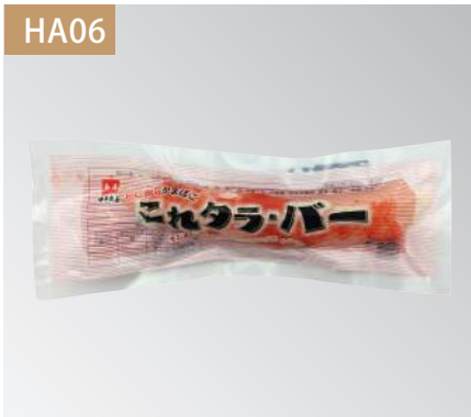
帝王蟹棒 規格：20入 x 4盒