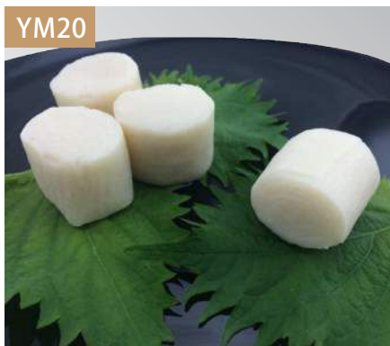
干貝風味 規格：3kg x 4袋入