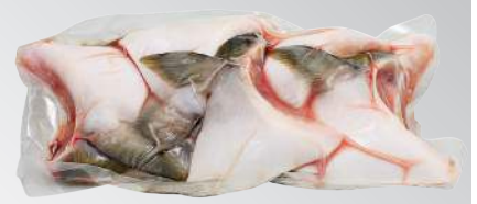
鱒魚下巴 規格：每片180~250克