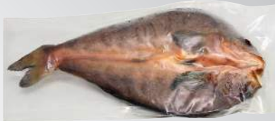
青花魚 規格：300克 (1尾)