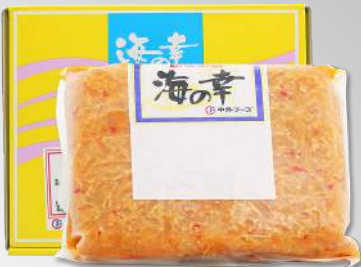
中華海蜇 規格：1公斤