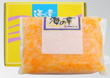
調味黃金紋甲 規格：1公斤