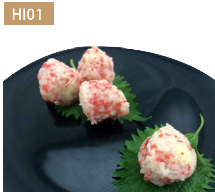
柳葉魚卵蝦球 規格：3kg x 4袋入