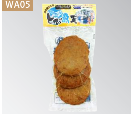
若女飛魚天 規格：20包 x 2盒