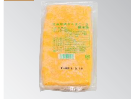
壽司蛋磚(玉子燒) 規格：550克