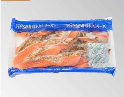
煙燻鮭魚肚 規格：1包20枚入