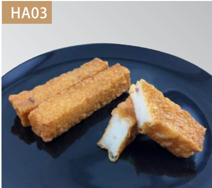
刺身天 規格：3kg x 4袋入