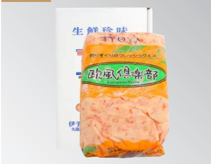
伊予屋龍蝦沙拉 規格：1公斤