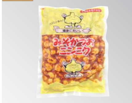
片山味增蒜頭 規格：500克