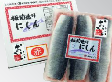
調味紅卵鯧魚 規格：900克