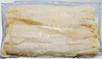
比目魚 規格：500克/1公斤