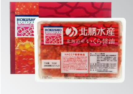
北勝鮭魚卵 規格：500克