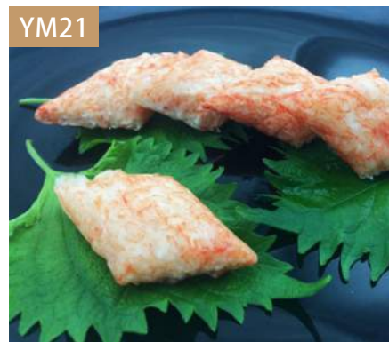
北海蟹角 規格：3kg x 4袋入