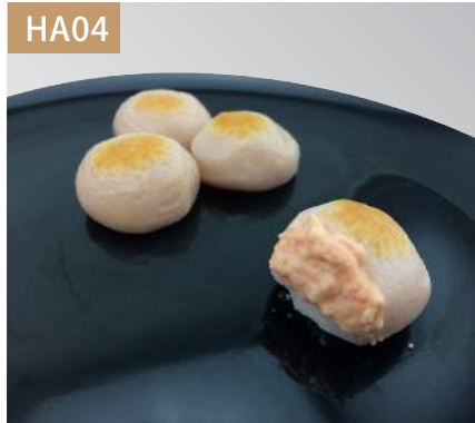
明太子球 規格：3kg x 4袋入