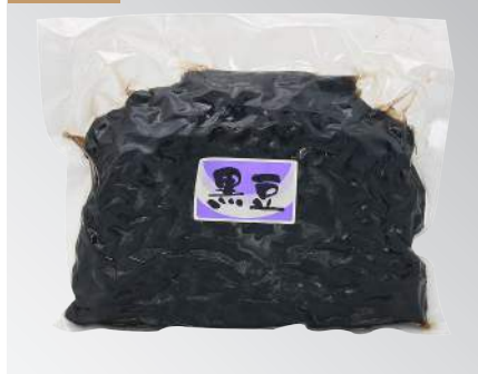
佃煮日本黑豆 規格：1公斤