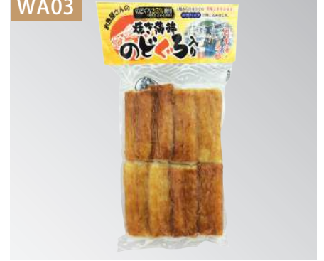
若女竹輪 規格：20包 x 2盒