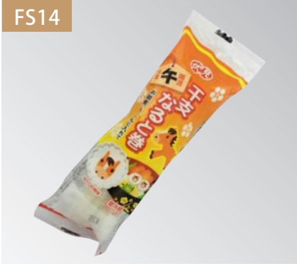
干支千代卷 規格：5入 x 12盒