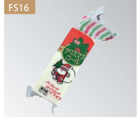
聖誕起司魚板 規格：10入 x 6盒