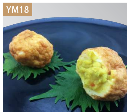
咖里丸子 規格：3kg x 4袋入