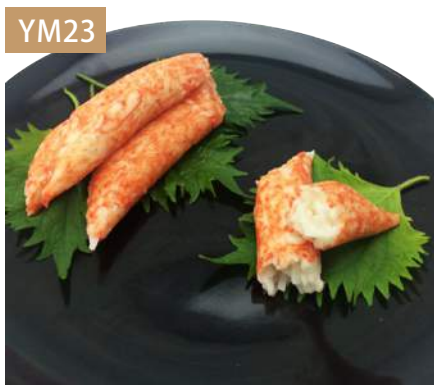
紅蟹腿肉 規格：3kg x 4袋入