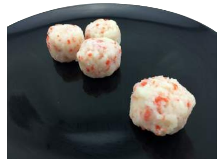
蝦球 規格：3kg x 4袋入