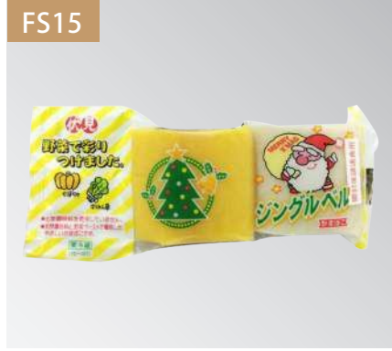
聖誕魚板 規格：10入 x 4盒