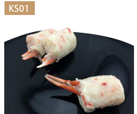
蟹爪丸子 規格：50入/包