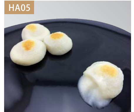
起司球 規格：3kg x 4袋入