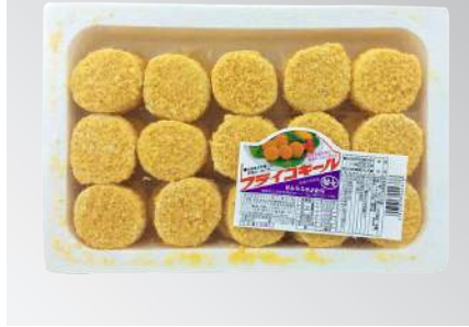
干貝酥30粒 規格：6入 x 2盒