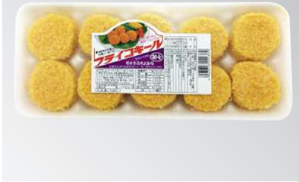
干貝酥10粒 規格：20入 x 2盒