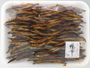
平松佃煮焼女子 規格：1公斤