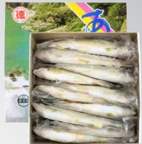
香魚 規格：1KG (6/7/8/9/10/12/14/16)尾