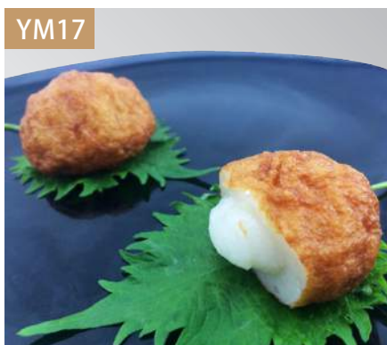
麻糬卷 規格：3kg x 4袋入