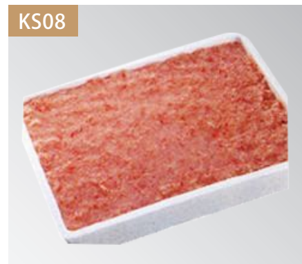
紅ズワイフレーク