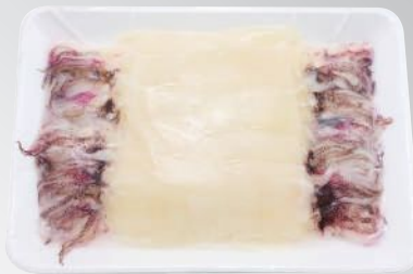
生食帶頭小花枝 規格：1盒(20尾)