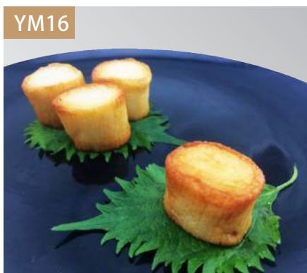
炸干貝揚 規格：3kg x 4袋入