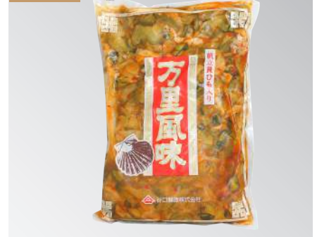
萬里風味 規格：一公斤