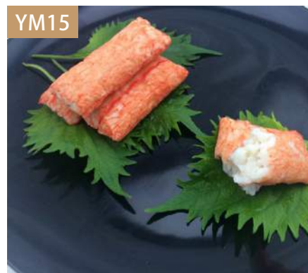
龍蝦肉 規格：3kg x 4袋入