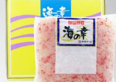
調味紅卵花枝 規格：1公斤