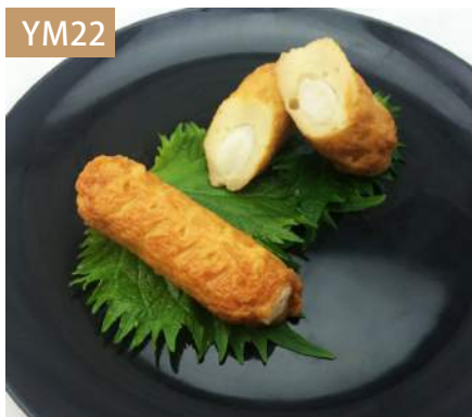
麻糬棒 規格：3kg x 4袋入